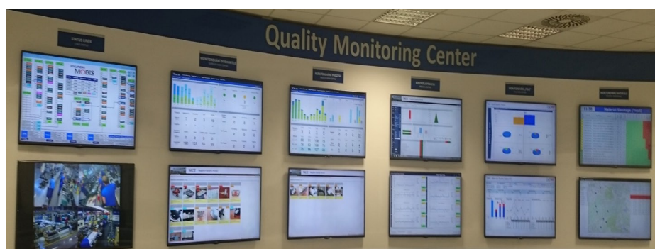
Foto z monitorovacího centra oddělení kontroly kvality společnosti MOBIS